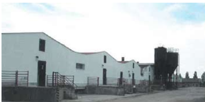
Farma Valovice PROMA

Ekonomické výsledky jsou zpracovány a dělí se o ně obě společnosti. Technologie je koncipována jako klasická zemědělská bioplynová stanice.