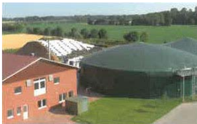
Bioplynová stanice Valovice

Řepařský institut Spikaly, druhý komplex v obvodu obce Katusice. Podnik se potýkal s podobnými poměry jako Zemědělská společnost i zde proběhla transformace podniků podobným způsobem, jak bylo prováděno v Zemědělské společnosti včetně vyrovnání vlastníků restitučními nároky a končící nájemní smlouvou. V průběhu dalších let se měnil management podniku včetně následné reorganizace podniku.