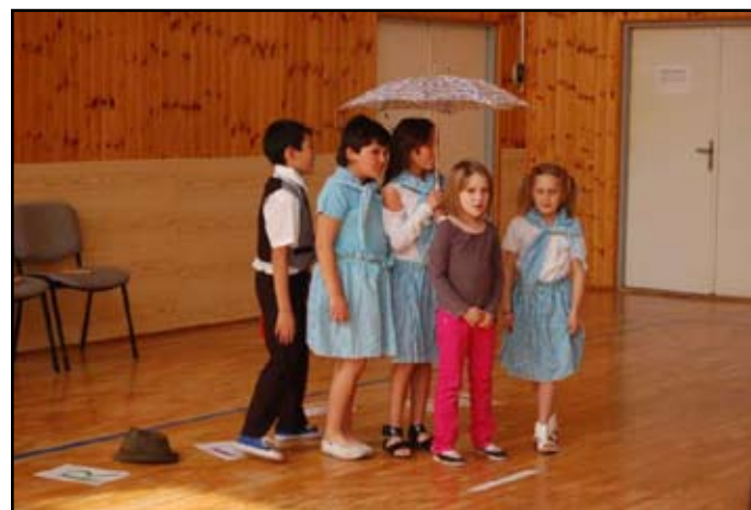
Vystoupení pro důchodce

nabídkou zájmových kroužků: Všeználek, Angličtina, Zdravotní kroužek, Mladý myslivec, Počítače, Flétna, Sportovky. Nadstavbově naše škola nabízí přípravu předškoláků, logopedickou nápravu a nápravu vývojových poruch učení, Angličtinu pro rodiče a děti.