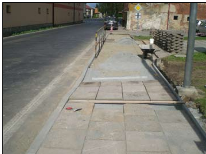
Přeložka chodníků v obci