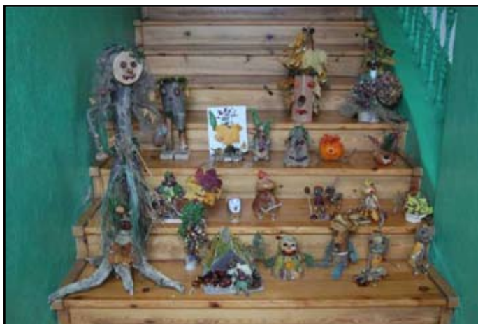
Podzimníčci – výrobky rodičů a dětí

Tato úprava umožnila našim dětem v poklidu poobědvat beze spěchu a cesty za každého počasí do jídelny v MŠ.