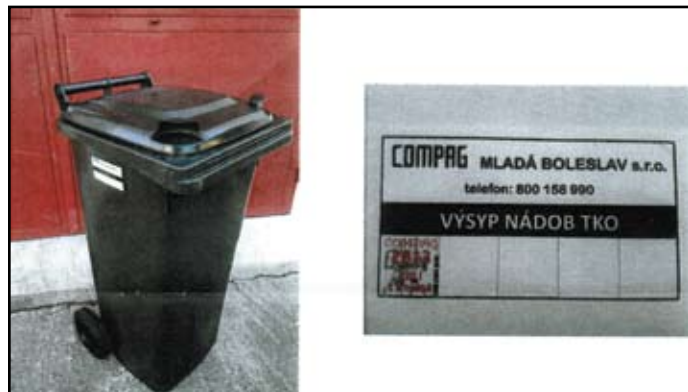
Umístění a vzhled nových nálepek Compag

Matrice pro vylepování ročních nálepek bude vylepena v horní části levého boku nádoby při pohledu na nádobu zepředu, odkud se otvírá. Roční nálepky nalepujte do volných polí matrice od levé strany.