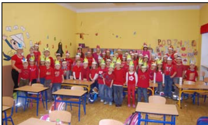
Barevný týden - Červené úterý - Amerika

Naše škola zůstává školou rodinného typu s individuálním přístupem k dítěti a těsnou spoluprací s rodiči. Na čemž je postaven náš školní vzdělávací program s názvem „Škola spokojených dětí“.