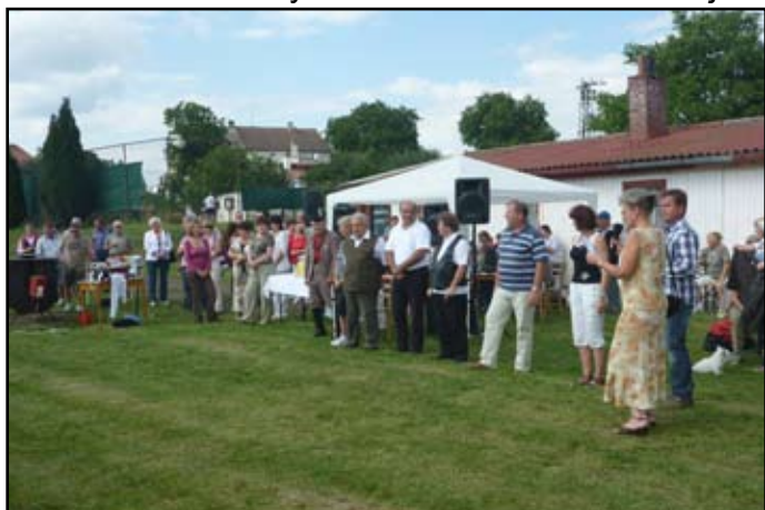
Oficiální zahájení oslav

- TJ Sokol Katusice ve spolupráci s obecním úřadem uspořádala v sobotu 8.září oslavy 100. výročí od založení SOKOLA v Katusicích. Oslavy probíhaly po celý den na hřišti v Katusicích. Ráno byl den odstartován turnajem