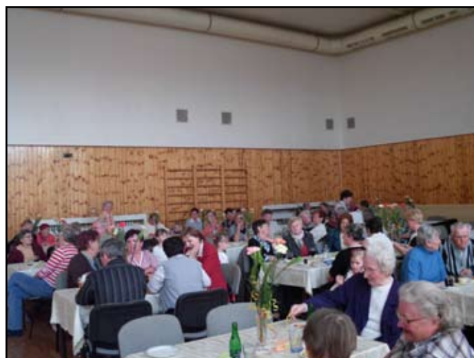
Posezení s důchodci

- 30. dubna jsme se sešli na dětském hřišti na náměstí, abychom vztyčili májku a poté