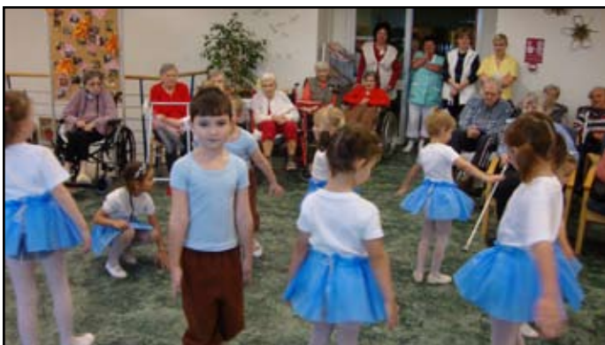
Taneční vystoupení v Domově důchodů v Mnichově Hradišti

V tomto roce popřály štěstí a zdraví tříkrálovým průvodem nejdříve lidem v naší obci, a potom i pacientům v LDN v Mladé Boleslavi. Nezapomněly ani na zvěř v lese a dovezly jim nasbírané kaštany a sklizenou mrkev. Na jaře se rozveselily při maškarním plese v mateřské škole, ale i na sále KD v Katusicích při „Sněhulákovém maškarním plese“, který pořádal