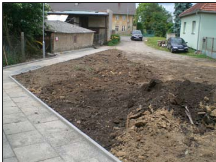
Chodník k mateřské škole

Chodník k mateřské škole – původní chodník do mateřské školy za hasičárnou vedl po soukromém pozemku, který chtěl vlastník použít jako přístupovou cestu k vlastnímu pozemku, proto obec vykoupila jiný pozemek a na něm zbudovala chodník nový včetně veřejného osvětlení. Tak zastupitelstvo obce vyřešilo bezpečný přístup do mateřské školy, protože chodník okolo staré benzinky je příliš úzký a pro děti, které do školky vedeme, nebo jdou na procházku, příliš nebezpečný.