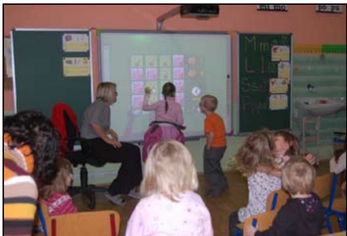
Den otevřených dveří

a širokou veřejnost, dále se účastníme obecních akcí jako Rozsvěcení vánočního stromu, Živý Betlém, Odpolední posezení pro důchodce a další. Vystupujeme v domovech důchodců. S podporou rodičů pořádáme týdenní letní tábor. Odpoledne našich žáků jsou naplněna širokou