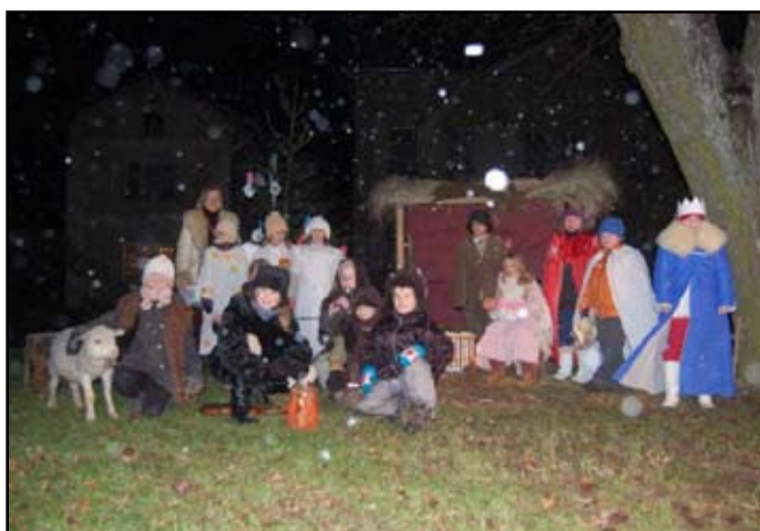
Živý Betlém - všichni účinkující ve sněhové vánici

projektů, besed a návštěv muzeí, výstav – toto vyučování názorem se nám velmi osvědčilo a děti si z něho uchovávají daleko více informací než z běžného výkladu. Důraz dáváme na etickou a environmentální výchovu. Chtěli bychom, aby naši žáci měli dobré základy slušného chování a úcty ke starším lidem, věděli jak se chovat k přírodě a nezapomínali na tradice naší vlasti.