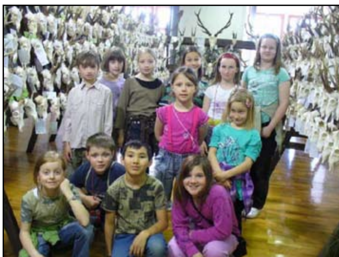
Mladí myslivci – na výstavě trofejí

- dalším rodičům, kteří na nás myslí s výpěstky ze svých zahrádek a dalšími věcmi, které využijeme v naší školní činnosti