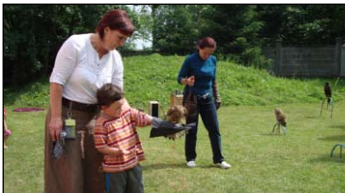
Sovy a dravci

a zpívaly hlavně pro rodiče. Předškolní děti zakončily docházku do mateřské školy plněním úkolů při celodenním výletu do „Muzea Eduarda Štorcha“ v Lobči a následným přespáním v mateřské škole. Poté byly vydekorovány paní starostkou a propuštěny dobře připravené do základní školy. Po začátku nového školního roku děti vytvořily výtvarné práce s tematikou „Cukrárna“ na Podzimní výstavu do Obce Březovice a následně na výstavu do Domova důchodců v Mnichově Hradišti. Svým sportovním vystoupením s rodiči potěšily všechny zúčastněné při 100. výročí Sokola Katusice. Při vítání nových občánků v obci potěší rodiče hezkou básničkou a předškolní děti potěší spoustou nových slovíček