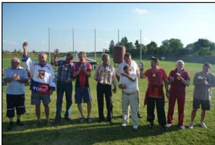
Vyhlášení výsledků turnajů

výstavy mu pomohla kulturní komise. Výstava měla veliký ohlas a potěšila mnohé rodáky.