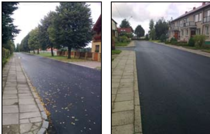
Oprava komunikace v Polní ulici

Oprava komunikací - v Polní ulici byl obnoven povrch komunikací od bytovek směrem k benzinové pumpě a vjezdy mezi okály. Opraveno bylo parkoviště před školou, vjezd za hasičskou zbrojnicí, dva kanály a jeden vjezd v Polní ulici, jeden kanál v Mšenské ulici.