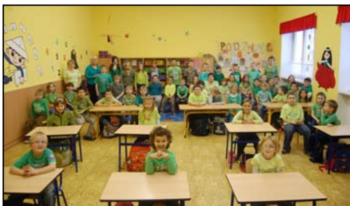
Barevný týden - Zelené pondělí - Austrálie

V tomto počtu žáků vyučujeme hlavní předměty v každém ročníku samostatně i když si stále zakládáme na spolupráci dětí různých ročníků. Vyučování v naší škole často probíhá formou