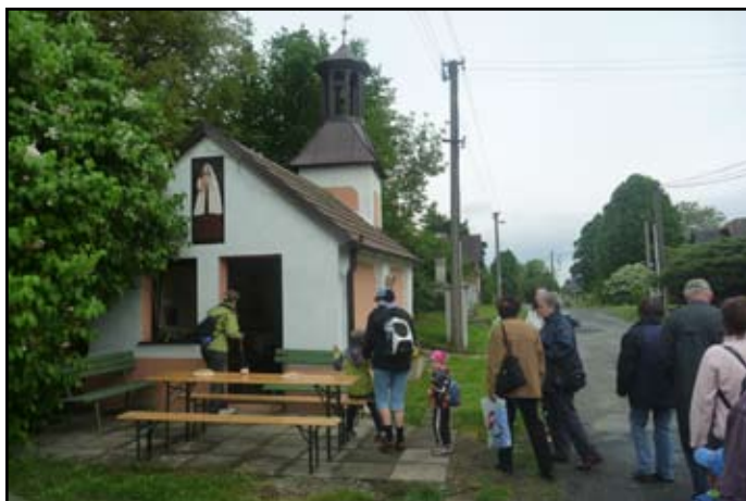
Zvonička v Trnové

i šátky, cesta byla příjemná, však ji zvládly i malé děti.