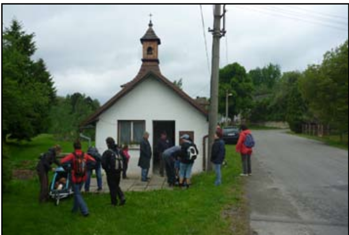
Zastavení v Doubravici

V Doubravici jsme ve zvoničce měli připravené pití, prohlédli jsme si obec a po té, co se k nám přidali obyvatelé Doubravice, pokračujeme do Lobče.