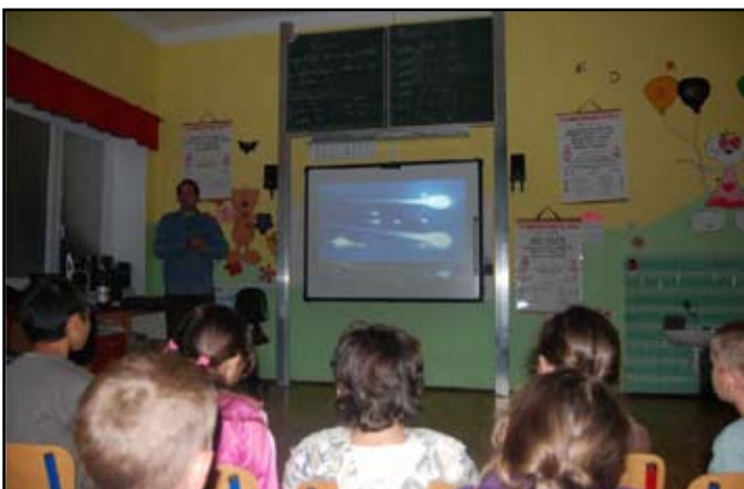
Astrobus v naší škole

Nakonec bychom rádi poděkovali obci Katusice, ale i okolním obcím Kovář, Sudoměř, Kovanec, Valovice, Bukovno, které podporují naši činnost, rodičům a všem ostatním, kteří nás podporují ať už sběrem starého papíru, finančním příspěvkem či pomocí.