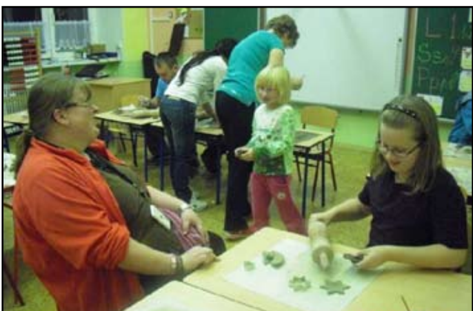
Předvánoční keramická dílna

Na dobré spolupráci s rodiči, a také s obecním úřadem Katusice, je postavena nabídka našich mimoškolních činností. Několikrát ročně pořádáme pracovní výtvarné dílny pro rodiče s dětmi