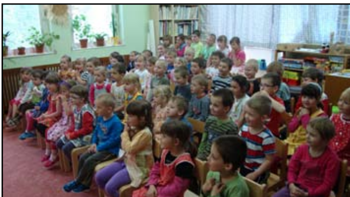
Vystoupení divadla Koloběžka

Před večerní „Filipojakubskou nocí“ si zařadily během dne při čarodějném průvodu lesem a obcí a večer při lampionovém průvodu.