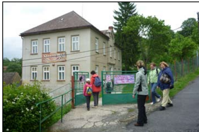
Před muzeem v Lobčín

cha. Tím končí naučná část dnešního výletu a jdeme do restaurace. Překvapilo nás, jak byla malá hospůdka na nás připravena a jak jsme se dobře najedli. No, dlouho sedět nemůžeme, vztyk a jdeme do Vrátna na vlak. Končí 4. poznávací výlet, účast byla hojná a těším se na další příjemné shledání.