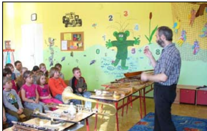
Seznámení s hudebními nástroji celého světa

nabídkou zájmových kroužků: Všeználek, Angličtina, Zdravotní kroužek, Mladý myslivec, Počítače, Flétna, Sportovky. Nadstavbově naše škola nabízí přípravu předškoláků, logopedickou nápravu a nápravu vývojových poruch učení, Angličtinu pro rodiče a děti.