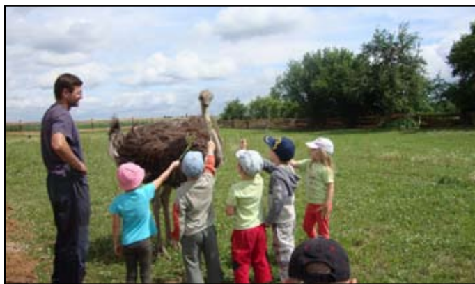
Školní výlet Sudomeř

Rodiče s dětmi z tanečního kroužku prožili hezký víkend v Máchově kraji.