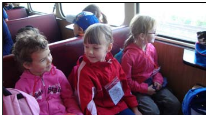
Výlet do Lobče

a zpívaly hlavně pro rodiče. Předškolní děti zakončily docházku do mateřské školy plněním úkolů při celodenním výletu do „Muzea Eduarda Štorcha“ v Lobči a následným přespáním v mateřské škole. Poté byly vydekorovány paní starostkou a propuštěny dobře připravené do základní školy. Po začátku nového školního roku děti vytvořily výtvarné práce s tematikou „Cukrárna“ na Podzimní výstavu do Obce Březovice a následně na výstavu do Domova důchodců v Mnichově Hradišti. Svým sportovním vystoupením s rodiči potěšily všechny zúčastněné při 100. výročí Sokola Katusice. Při vítání nových občánků v obci potěší rodiče hezkou básničkou a předškolní děti potěší spoustou nových slovíček